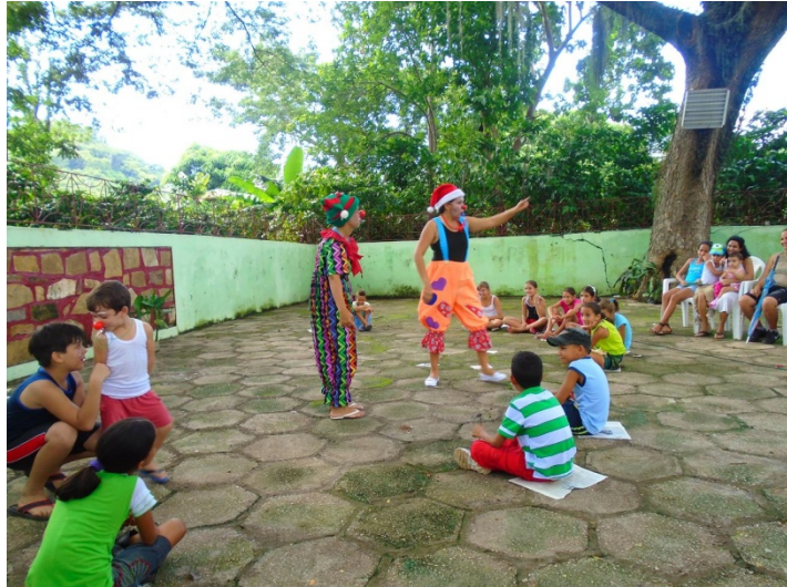
Proyecto Musas inquietantes en San Pablo de Yao, Sierra Maestra.