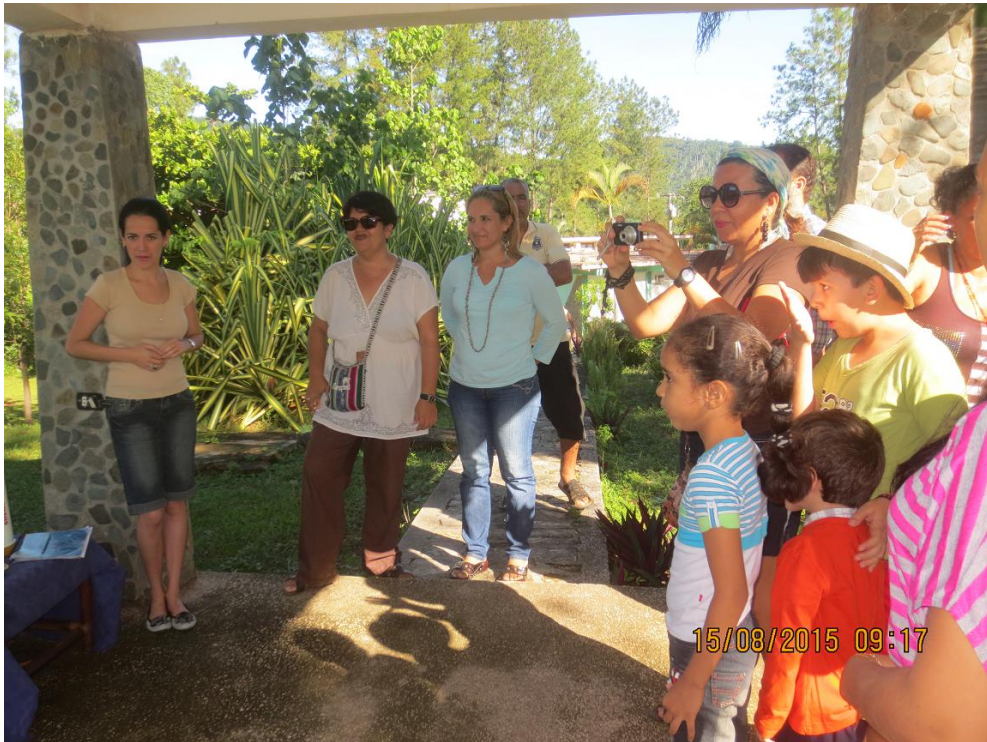
Recibimiento en la TV Serrana.