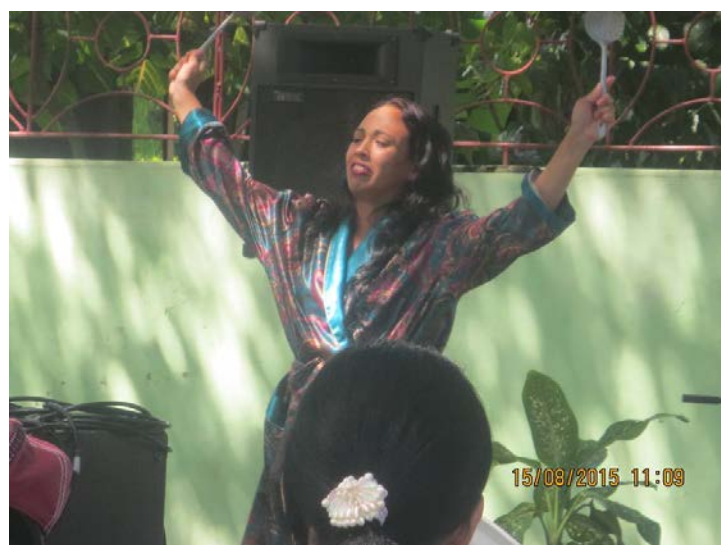
Fragmento del monólogo Máscaras en mi isla, de la autoría de Juventina Soler.