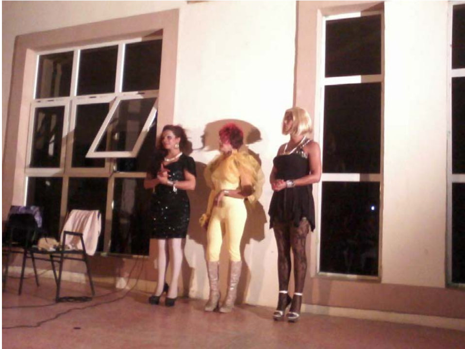
Miembros del proyecto HSH de Granma, invitados por Musas inquietantes. Paseo General García. Bayamo.