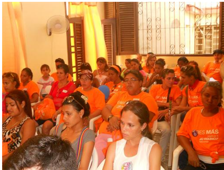
Proyecto Venus de mujeres lesbianas