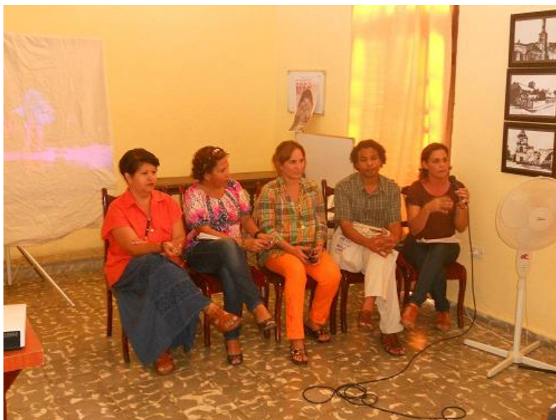
Integrantes del proyecto Musas Inquietantes.

El año 2015 el proyecto “Musas inquietantes”, que está focalizado para trabajar dentro de la campaña por la NO VIOLENCIA hacia las mujeres y las niñas y, además, interviene directamente en la comunidad, fue convocado a iniciar la campaña nacional por la No violencia por la ONG “Oscar Arnulfo Romero”. Estuvieron con las “Musa...” el proyecto HSH, “Venus” de mujeres lesbianas y una representación de la ONG.