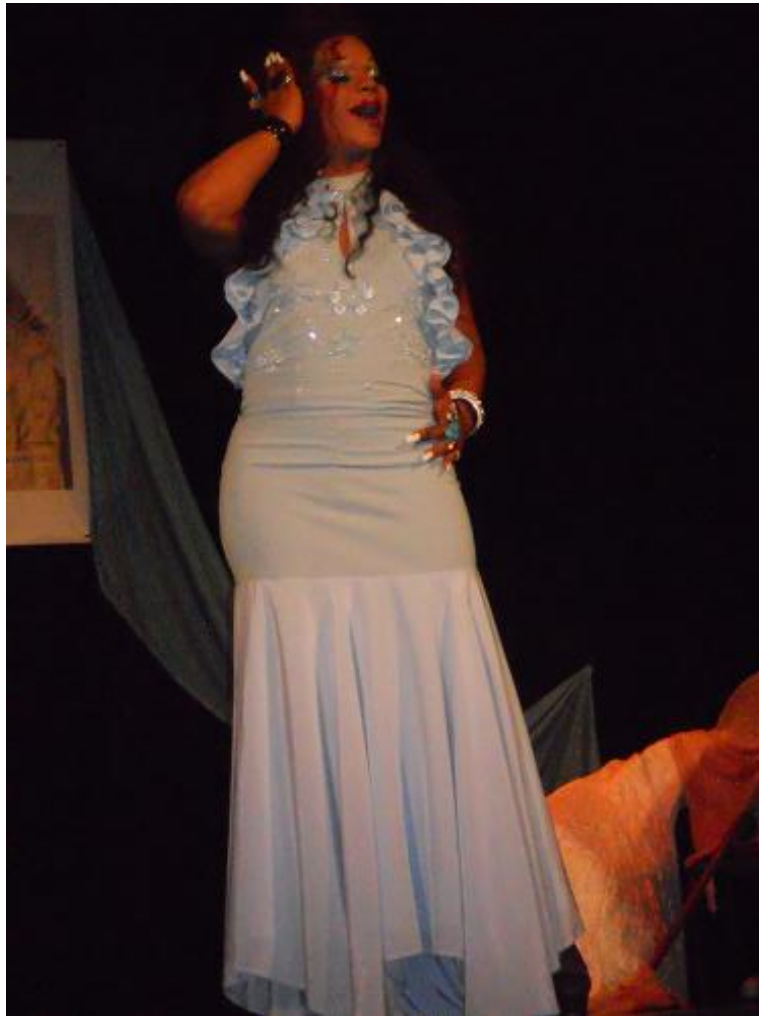
Proyecto HSH (Hombres que tienen Sexo con Hombres)