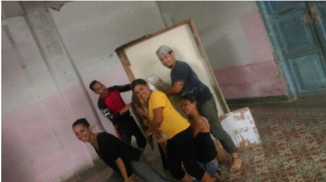
Actores de la guerrilla