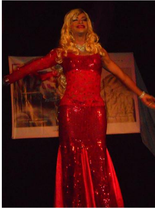
Proyecto HSH (Hombres que tienen Sexo con Hombres)