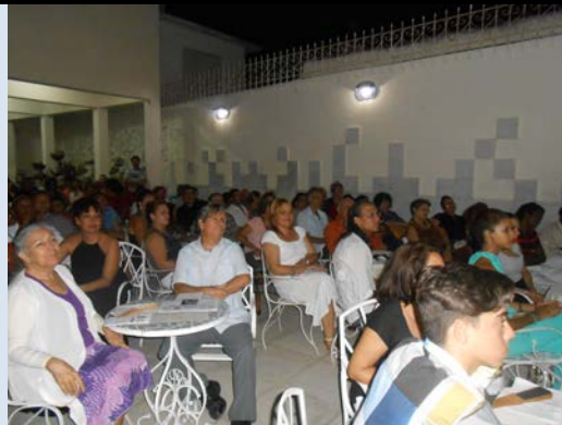
Participantes en la actividad de celebración

Estos 55 años serán para la Uneac continuidad de un trayecto histórico donde el verdadero protagonista es el pueblo, la Patria, por ello se hace imprescindible doblegar los esfuerzos en el orden intelectual, artístico, social. Difícil tarea es andar codo con codo cargando diferencias generacionales que tienden a tergiversar el rumbo de nuestra identidad apartada de las esencias culturales; pero nada es imposible, a tiempo se gana tiempo.