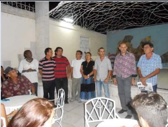
Nuevos miembros de la Uneac

Abanderados de la dignidad, los miembros de esta reconocida y respetada organización, mostraron a los presentes su calidad artística, como muestra del júbilo permanente por ser parte de una vanguardia responsabilizada con el devenir histórico de la cultura y que actualmente ha logrado un ascenso en la incorporación de nuevos miembros. Lo anterior es muestra de la indeleble labor realizada por las diferentes filiales antes y durante el proceso de selección de quienes hoy se inician en tan alta responsabilidad.