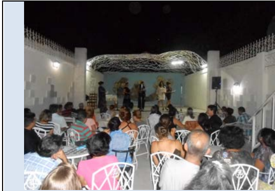
Escritoras durante la lectura de poesía en la actividad

E l patio de la sede provincial sirvió de escenario en la noche de este 22 de agosto para recibir a quienes se empeñan cada día en hacer un mejor arte para contribuir al mejoramiento humano. Una actividad con la presentación de artistas miembros, cerró la programación elaborada en saludo a los 55 años de creada la Uneac.