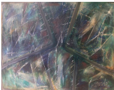
Destellos en profundidad