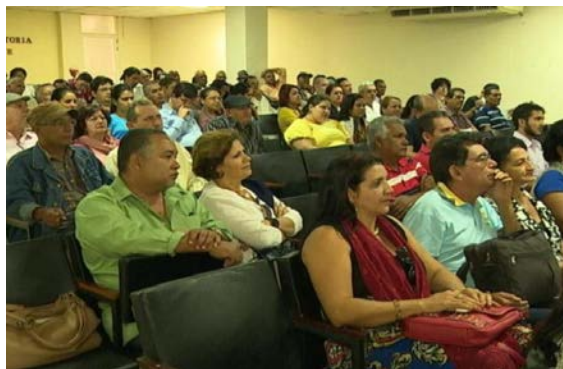
Participantes en la Asamblea de la Uneac.

Homenaje por el aniversario 115 del natalicio de Guillén (10 de Junio)