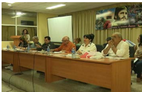
Presidencia de la Asamblea de Balance 2017

Entre las principales proyecciones de las filiales para el 2017 menciono la prioridad a las acciones en los proyectos comunitarios, la atención a los creadores no miembros de la Uneac con resultados en su trabajo, el potenciar el rescate de las raíces danzarias, así como los monólogos y unipersonales, continuar trabajando con los alumnos y profesores de la Escuela Profesional de Arte El Cucalambé, con particular atención a la Noche de concierto, y desarrollar actividades promocionales de repentismo en coordinación con la Casa Iberoamericana de la Décima, entre muchas otras proyecciones de cada filial nuestra. Múltiples son las actividades que desarrollan los artistas en nuestra sede, por lo que las mismas llevan el compromiso de la necesaria calidad en cada presentación. De manera general nuestra asamblea marca una nueva etapa para continuar desarrollando el trabajo directamente con los habitantes de esta ciudad, que lleva el nombre de planta espinosa y que lucha día a día porque la máxima de nuestro líder indiscutible Fidel Castro, no sea solo una frase y sí una realidad, porque en el sentido más amplio, La cultura es lo primero que tenemos que salvar.