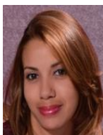
Por Yudith Vázquez Núñez

Especialista de Proyectos Cieric-Uneac Las Tunas