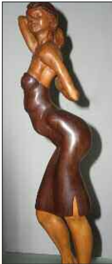
Encabezando este artículo, en la página 2, una talla en madera de Fowler y a la izquierda, una de Llins.

Durante todo el curso, los talleristas dan riendas sueltas a su imaginación y se preparan para su participación en el evento «Fowler in memoriam», una exposición colectiva que tiene como escenario la Galería municipal HER-CAR,